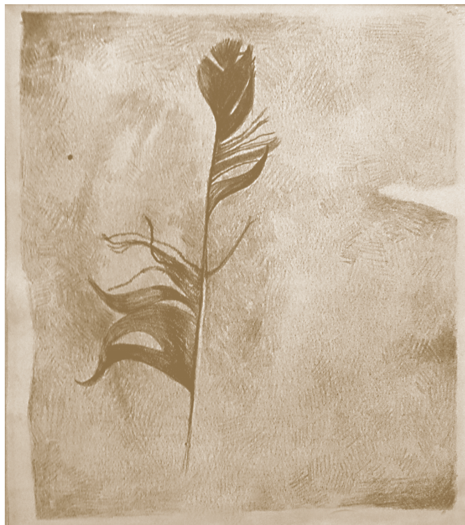
Ferenczy Botond grafikus illusztrációi

tozunk Istenünknek, hanem életünk minden egyes napján. Rendelkezésünkre álló énekeink szöveg- és dallamvilágával is áldozunk Istennek hálával!