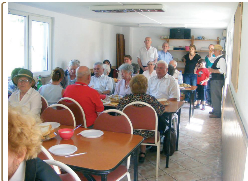
Szeretetvendégségen a bogártelki Filemon Házban

A gyülekezeti ház felszentelésének e jeles évfordulóján hálás szívvel és köszönettel fordulunk azon testvéreink felé, akik ezen álmunk valóra váltásában segítséget nyújtottak. De mindenkifelett Istené legyen a dicsőség!