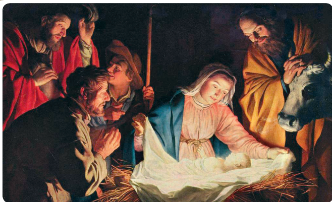
Gerard van Honthorst: Pásztorok imádása