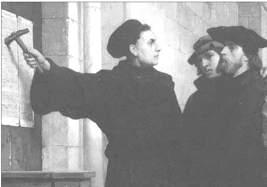
Luther kiszögezi téziseit a wittenbergi vártemplom kapujára (Ferdinand Pauwels, 1872)