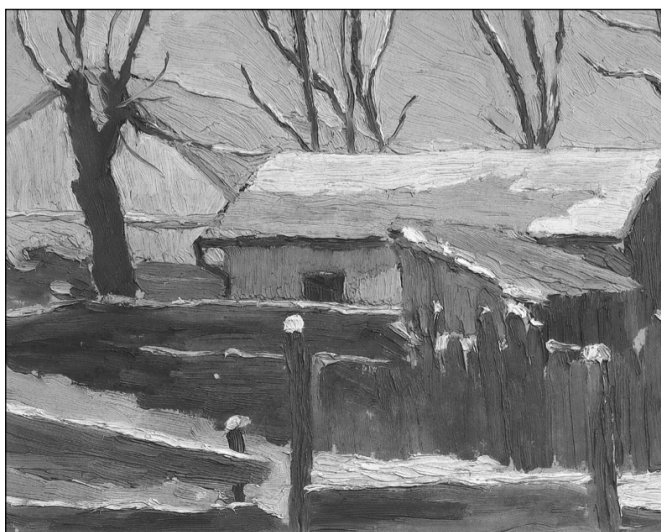
Gy. Szabó Béla Tél

Jézus Krisztus személyének a csodája a hitre nézve abban van, hogy benne Isten jelentette ki magát, Ő a testté lett Ige. A Logos megtestesülése Ő. Jézus emberré létele a keresztény hit legnagyobb titka. Megfogni, megérteni emberi logikával nem lehet – reménykedni és hinni annál inkább. Hinni abban, hogy az Örökkévaló a maga örök rendeléséből, az emberi idő egyik pontján emberi formát vett fel. Érettünk. Érettem. Éretted!