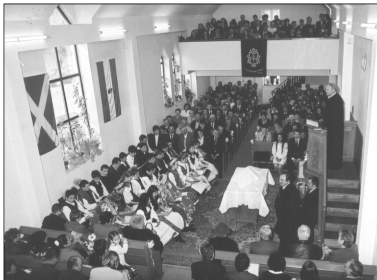
Konfirmálásakor megtelik a templom népviseletbe öltözött ifjakkal

– Visszatekintve nyugodt lélekkel el tudom mondani, hogy kudarcaim sosem voltak. Mindig tudtam, mit lehet megvalósítani: álmodtam, de nem álmodoztam. Sok mindent sikerült elérnem, e mögött azonban mindig ott állt a családom. Ha megkérdezték tőlem, mi a sorrend az életemben, azt feleltem: első a gyülekezet, aztán megint a gyülekezet, aztán a család. Megértő családom van, akik sosem sérelmezték, hogy esetleg karácsonykor várniuk kellett, hogy együtt tudjunk asztalhoz ülni, ezt azonban most kárpotólják a vasárnapok, amikor együtt lehetünk mindannyian. Jutulomként éltem meg, hogy ilyen családom és ilyen gyülekezetem lehetett, ez mindig erőt adott. Hiszem, hogy a gyülekezet és a munkatársaim ezentúl is mellettem lesznek, együtt sok mindent megvalósítunk, mindezért pedig egyedül Istené a dicsőség, hiszen mind ez ideig megsegített, és hiszem: Ő tudja, mi az, amire szükségünk van.