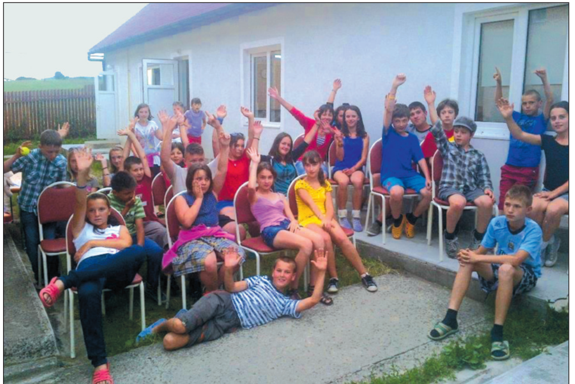
Jól sikerült táborozás a bogártelki gyülekezeti házban